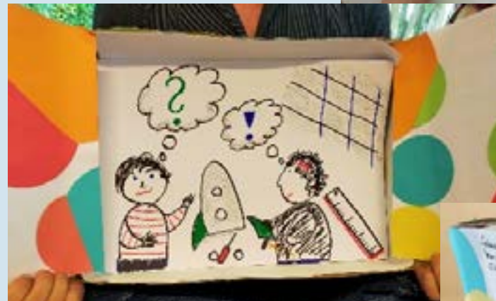
Das bunte Ergebnis – unser „Anti-Stereotypen Kamishibai“